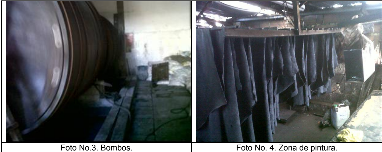
Foto No.3. Bombos.