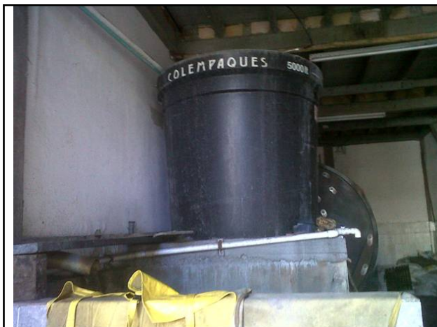
Foto No.1. Tratamiento fisicoquímico.

Las aguas residuales industriales inician su pre-tratamiento, en cárcamos con rejillas que lleva a la trampa de grasas, para luego ser conducidas en una caja de homogenización de donde son bombeadas al tratamiento fisicoquímico, el cual se lleva a cabo en un tanque plástico de 5.000 litros, finalmente estas aguas son descargadas al sistema de alcantarillado público.